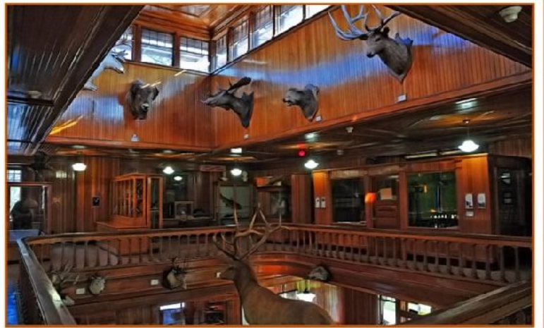
Banff Park Museum

Questa mattina presto, a Banff, andrete in visita del più antico Museo delle Montagne Rocciose. Poi farete il piccolo tour di Banff e partirete con la Gondola, la navetta che vi porterà sulla Sulphur Mountain ad uno dei punti di osservazione più spettacolari di tutte le Rocciose. Qui potrete pranzare sulla magnifica terrazza. Infine vi metterete in moto nel primissimo pomeriggio per