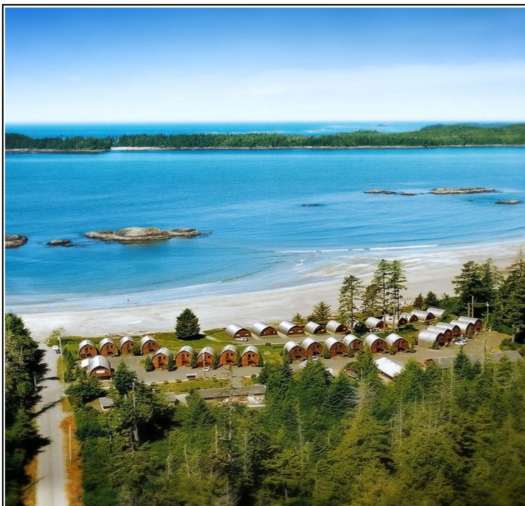
Tofino il resort di fronte al pacific Rim

ITINERARIO QUOTATO CON LISTA SERVIZI ROAD BOOK CONSEGNATO ALL'ARRIVO