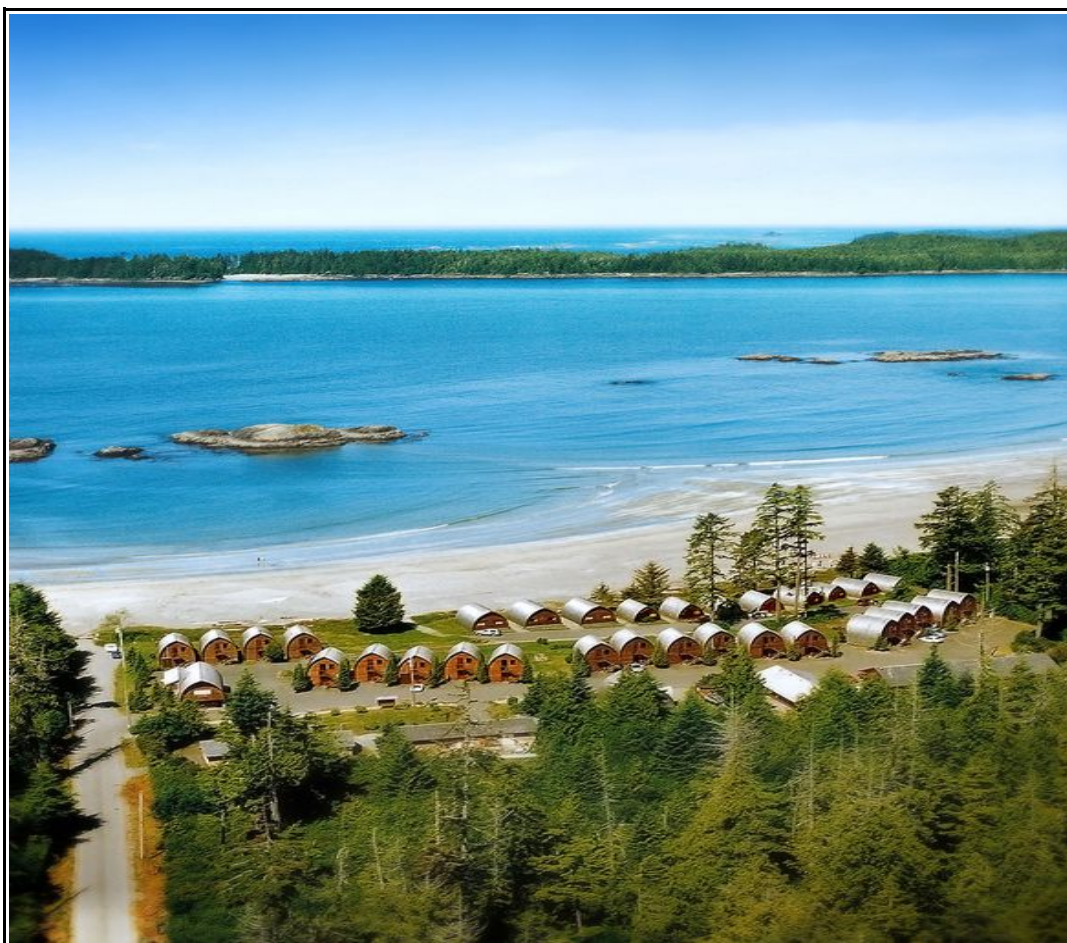
TOFINO E IL SUO RESORT DI FRONTE AL PACIFIC RIM

WEST COAST & QUEEN CHARLOTTE ISLAND 17 GG