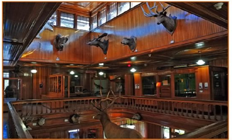
Banff Park Museum

Questa mattina presto, a Banff, andrete in visita del più antico Museo delle Montagne Rocciose. Poi farete il piccolo tour di Banff e partirete con la Gondola, la navetta che vi porterà sulla Sulphur Mountain ad uno dei punti di osservazione più spettacolari di tutte le Rocciose. Qui potrete pranzare sulla magnifica terrazza. Infine vi metterete in moto nel primissimo pomeriggio per