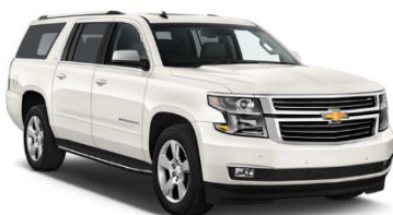
Chevrolet Suburban mod. 2018