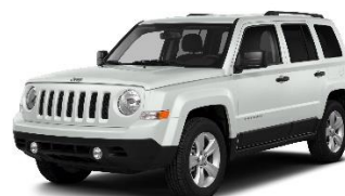
Jeep Patriot mod. 2018