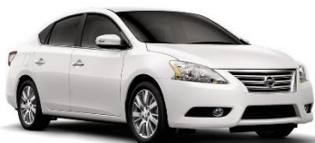
Nissan Sentra mod. 2018

(il costo addizionale per l'accompagnamento a cura di una nostra guida/conducente italiana è di 2.583 EURO, carburante incluso)