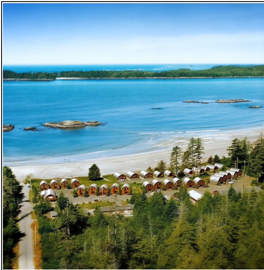
FOTO SAFARI-ESPLORAZIONE WEST COAST & QUEEN CHARLOTTE ISLAND 17 GG PROP. 85-020