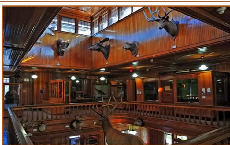
Banff Park Museum