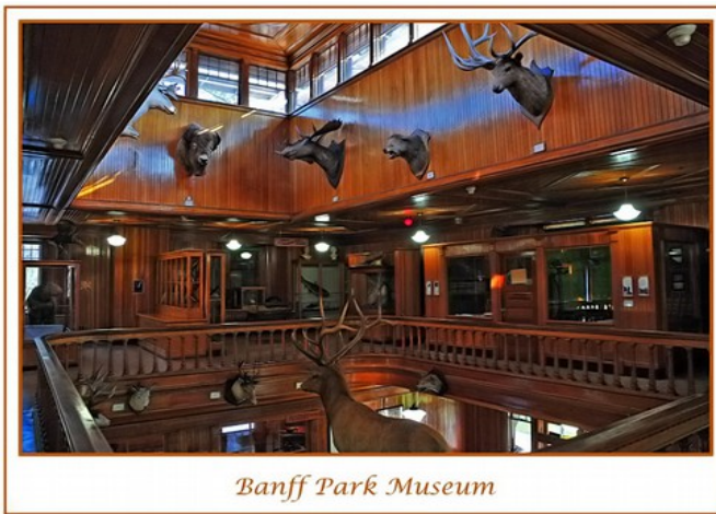
Banff Park Museum